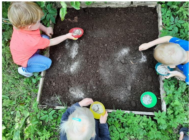
Wat verse potgrond erop en dan bloemetjes zaaien.