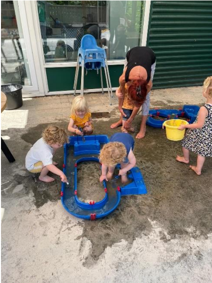
Heel simpel, maar ontzettend leuk.

We proberen zoveel mogelijk met de kinderen naar buiten te gaan, maar als dat even niet lukt, kun je binnen natuurlijk ook hele leuke dingen doen. Zoals picknicken. Niet aan tafel voor drinken en koek, maar gewoon met zijn allen op de grond op een kleed. Wederom simpel, maar ook weer super leuk.